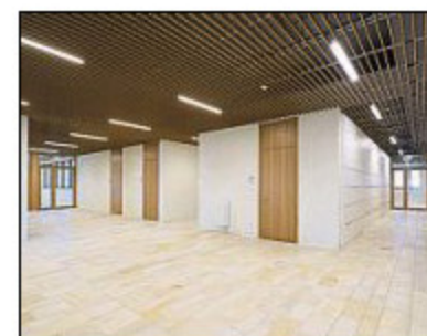
Der Natursteinboden der FOS/BOS in Regensburg.

schen 2017 und 2019 das Projekt „99 Hudson“ realisiert. Dieses Gebäude ist nun das höchste in Jersey City, direkt gelegen am Hudson River gegenüber von Manhattans berühmtem Financial District. Hier wurden rund 20 000 Quadratmeter Jura Kalkstein an der Fassade angebracht. Das Gebäude zielt nun die Skyline von New Jersey.